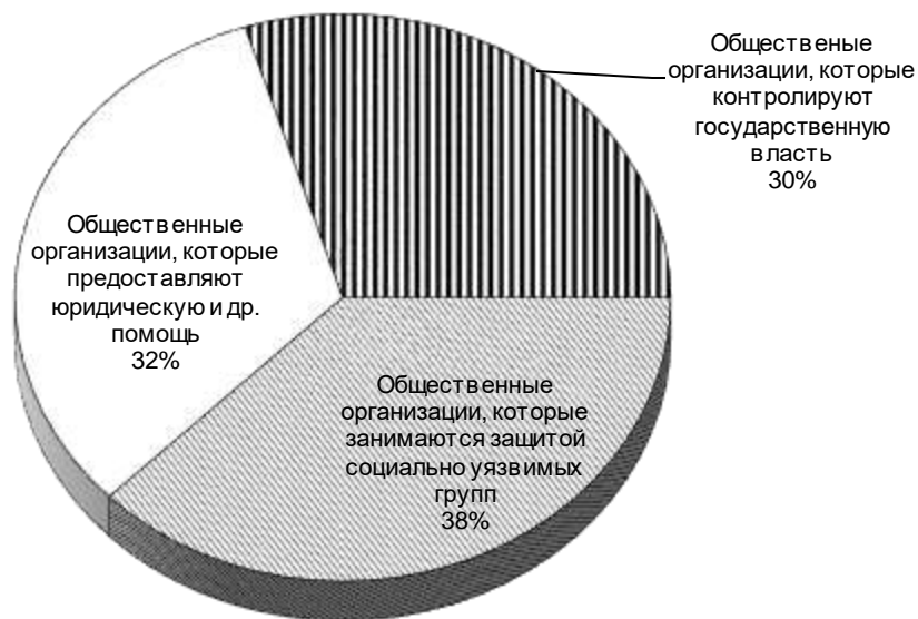
Рис. 2. Разделение мнения граждан относительно роли общественных правозащитных организаций Украины по направлению деятельности в % соотношении к общему числу

Источник: составлено на основании данных [3]