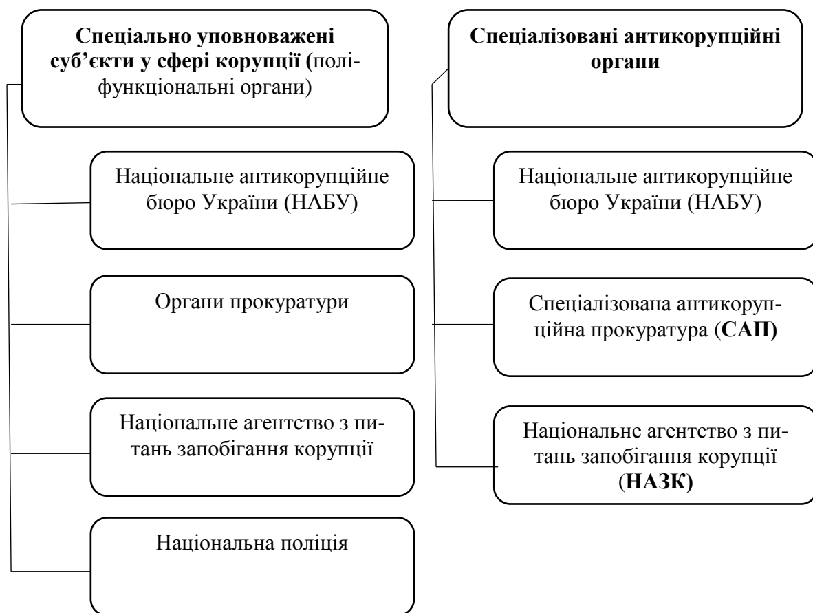
Рис. 2. Спеціалізовані антикорупційні органи

Слід зауважити, що саме спеціалізованими суб'єктами в боротьбі проти корупції в Україні, які на сьогодні діють, є три органи, це НАБУ, САП та НАЗК. Крім цього, існує ще один «антикорупційний орган» – Державне бюро розслідувань (ДБР), який по суті вже створено, але він ще не функціонує. Більш того, існують й інші поліфункціональні органи, такі як Національна поліція, Служба безпеки України (СБУ), органи прокуратури, які охоплюють велике коло правовідносин, не обмежуючись лише антикорупційними заходами. (рис. 2).