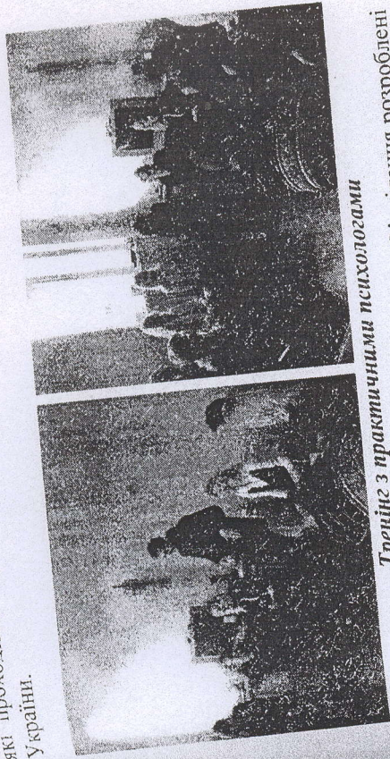
Тренінг з практичними психологами

Проблеми екстремальної та кризової психології. 2008. Вип. 5 Неодноразово проводились тренінги та майстер-класи із практичними психологами служби психологічного забезпечення МНС, які проходили перепідготовку в Університеті цивільного захисту України.