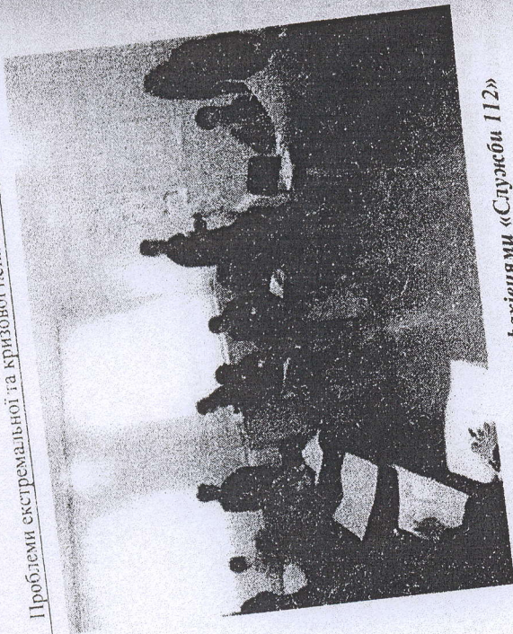
Тренінг з фахівцями «Служби 112»

З рятувальниками, які брали участь у ліквідації наслідків авіакатастрофи в м. Суха Балка Донецької області (2006 р.), було проведено тренінг «Вияжити та врятувати», спрямований на навчання використання особистісних ресурсів для подолання психотравмуючої ситуації, спрямованих на зниження рівня тривоги, набуття навичок пілесного та емоційного розслаблення, підвищення рівня емпатії та вміння отримувати підтримку від колег у надзвичайній ситуації.