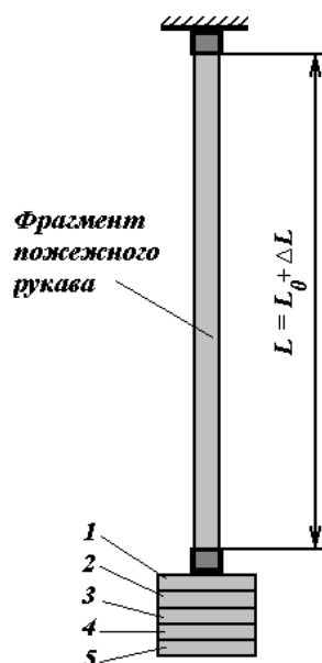
Рис. 1. Дослідна установка із встановленим фрагментом пожежного рукава типу «Т» з внутрішнім діаметром 51 мм

Для визначення позовжньої жорсткості пожежного рукава типу «Т» з внутрішнім діаметром 51 мм було використано дослідну установку, схема якої наведено на рис. 1. Установка була змонтована в лабораторії кафедри інженерної та аварійно-рятувальної техніки Національного університету цивільного захисту України.