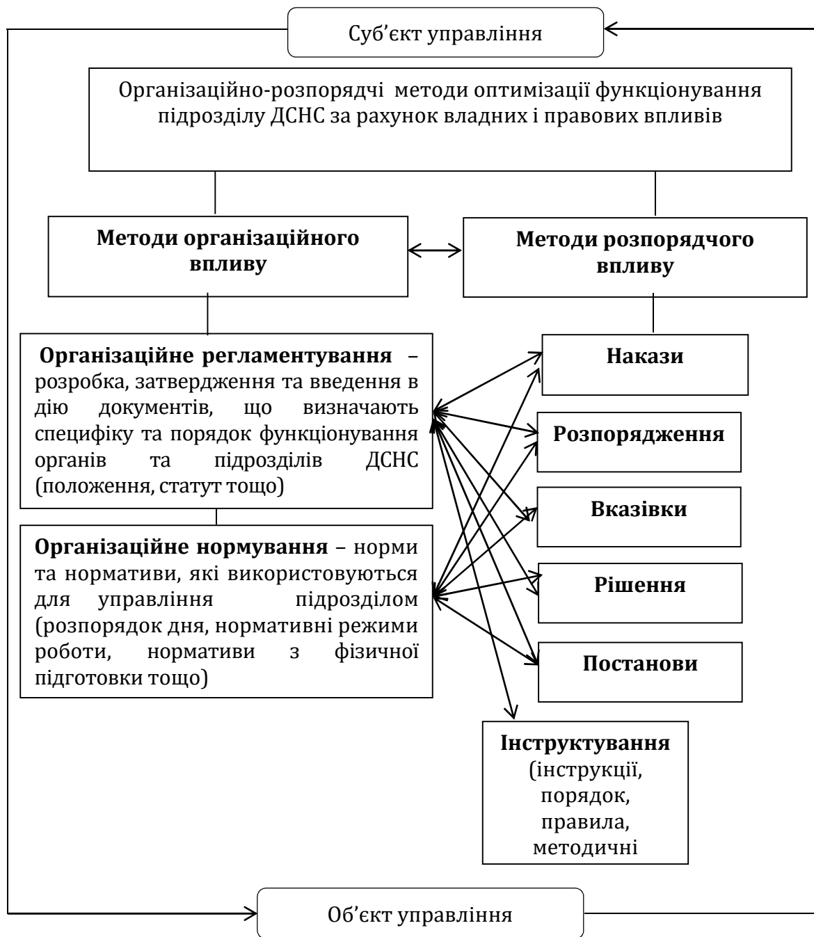
Рис. 1. Система організаційно-розпорядчих методів управління персоналом підрозділу ДСНС України

Виходячи із підзаконного характеру організаційно-розпорядчої діяльності підрозділів ДСНС України, ефективне застосування організаційно-розпорядчих методів досягається лише шляхом дотримання принципу законності в управлінні. Це означає, що управлінські відносини повинні бути врегульовані законами, а нормативно-правові акти, що є вираженням адміністративних засобів впливу, повинні ґрунтуватися на чинному законодавстві.