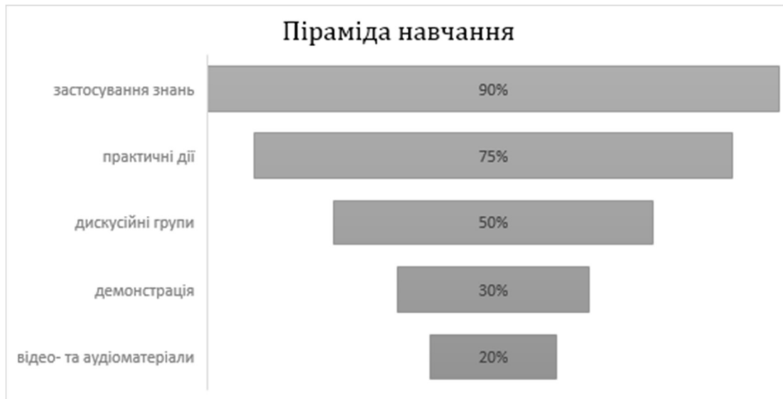
Рис. 1. Піраміда навчання

Завданням педагога стає створення комфортних умов навчання, за яких курсанти або студенти, отримуючи конкретний результат, відчують свою успішність, інтелектуальну спроможність, виявляють ініціативу, що робить процес навчання більш продуктивним.