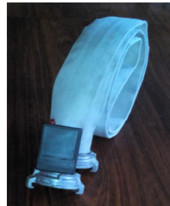
Рис. 4. Пожежний рукав з сигнализатором напруги у складеному вигляді/Fire sleeve with voltage signal in the folded form

Після виконання герметизації та фіксації з'єднувальних головок. На пожежний рукав встановили сигнализатор напруги в корпусі. Провідники від з'єднувальних головок приєднали до сигнализатора напруги.