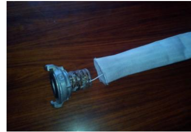
Рис. 3. - З'єднувальна головка з провідником прокладеним всередині пожежного рукава/ The connecting head with the conductor is laid inside the fire hose

головки проклали в середині пожежного рукава (рис.3.).