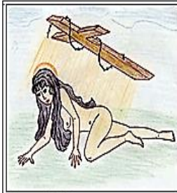
Рис. 1. Малюнок учасника групи АСПП. «Мій звичайний емоційний стан»

У психічному житті дитини досить рано з'являється інтерес до інтимної сфери життя людини. Перші сексуальні порухи дитини спрямовуються на найближчих людей (батьки, брати, сестри) [14]. Серед цих заборонених жадань переважають потяги до батьків, які згодом дитина починає відчувати через «Табу», що каталізує виникнення несвідомої вини.