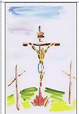
Рис. 5. Малюнок учасника групи АСПП. «Подія, до якої не хотілося б повертатися»