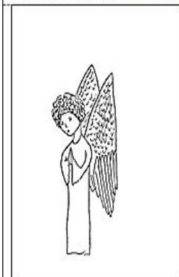
Рис. 4. Малюнок учасника групи АСПП. «Власне тату»