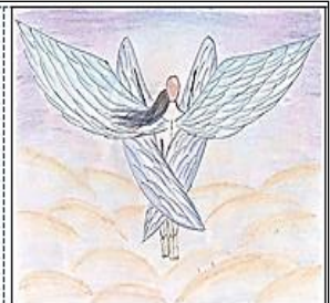
Рис. 3. Малюнок учасника групи АСПП. «Мій сексуальний партнер»