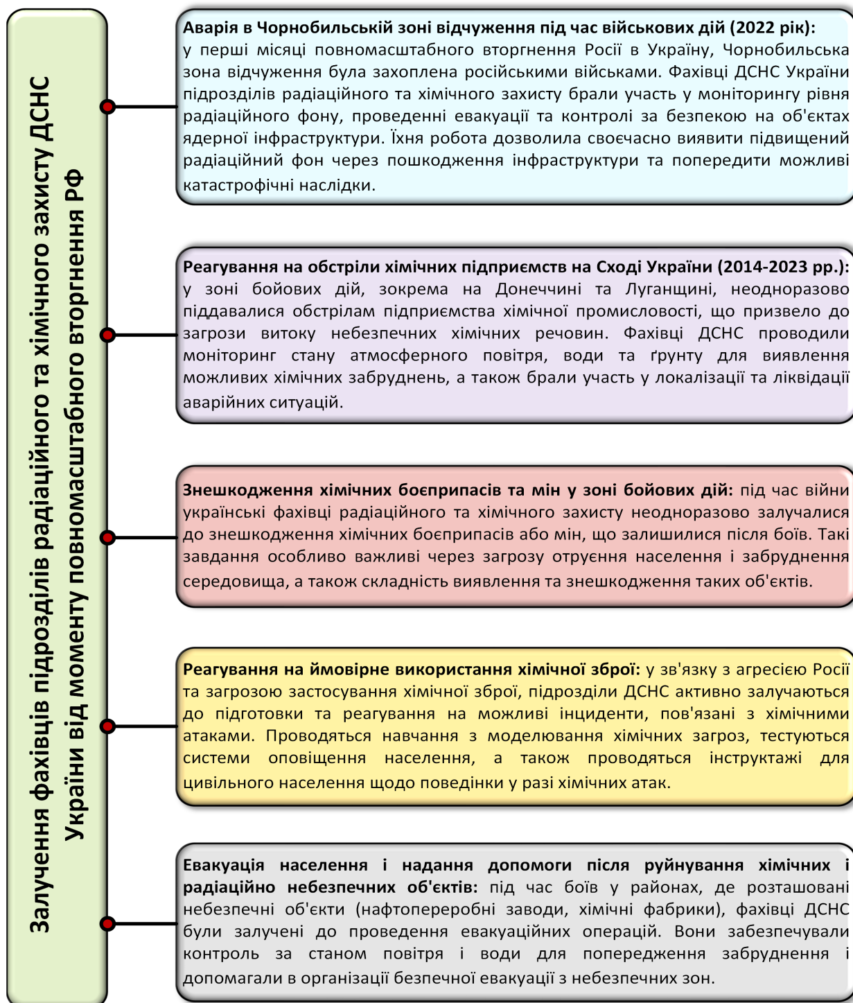
Рис. 1. Залучення підрозділів радіаційного та хімічного захисту від моменту повномасштабного вторгнення Російської Федерації

повномасштабного вторгнення представлені на рис. 1 [13].