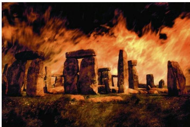
Рис. 3. Ілюстрація до статті Г. Уеллса про «ямників» (пращурів українців) — «найбільш вбивчих людей усіх часів»

У матеріалах періоду інформаційної атаки на пращурів українців у заголовках і в текстах науково-популярних матеріалів нападників називали «ямниками» (фр. — les Yamnayas [12], англ. — the Yamnaya [13]), а в більшості ілюстрованих видань обов'язково ототожнювали зону їх появи зі степами Дикого Поля. У них зазвичай безапеляційно наголошувалося на тому, що «ямники» майже на 100% винищили європейських фермерів — нащадків тих, хто винайшов землеробство на Близькому Сході, поширив його на Захід, будував там тисячі мегалітичних споруд — менгірів, дольменів, великих і малих кільцевих споруд, подібних до Стоунхенджа.