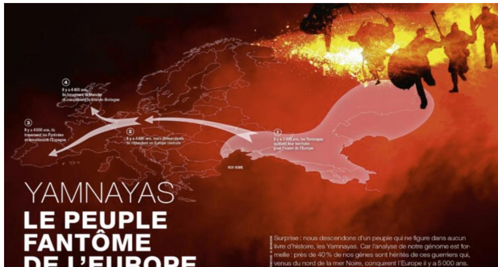
Рис. 2. Заголовок статті у журналі «Science & Vie», яка описує кривавий марш пращурів українців (ямників) аж до Атлантики і Британських островів

В Інтернеті кожен з читачів без найменших труднощів може відшукати приблизно 13 500 матеріалів для слів «Yamnaya genocide», 29 000 — для «Yamnaya violent». Але всіх перевершив Heinrich Wells винайденням рис. 3 [13], що й зараз фігурує в різноманітних виданнях при вміщенні в них матеріалів про часи європейського неоліту та енеоліту.