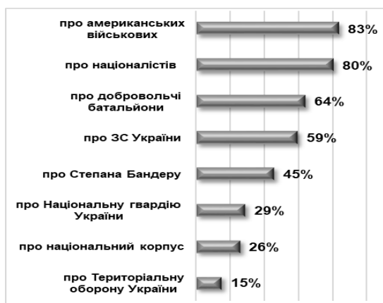
Рис. 3. Рейтинг інформації, яка цікавила противника під час допитів військовополонених, %

У той же час, слід зазначити, що активний супротив спрямований на звільнення із полону, вступання у дискусії із противником по темах ідеологічної обробки населення країни-агресора – має протилежне значення щодо ефективності для виживання у полоні, свою позицію та аргументацію «істини» противник відстоює виключно із посиленням заходів фізичного впливу, тортур та катування військовополонених.