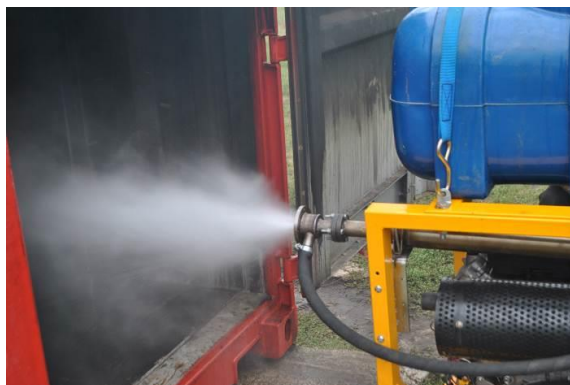
Рис. 1 – Отримання ТРВ за допомогою установки пожежогасіння періодично-імпульсної дії

Тому останнім часом велика увага при створенні нових перспективних зразків техніки для гасіння пожеж приділяється установкам, здатним подавати ТРВ відповідної дисперсності з потрібною продуктивністю. Одним з даних напрямків є застосування газодетонаційної технології для отримання тонкорозпиленої води. Реалізація газодетонаційної технології з отримання ТРВ на практиці можлива за рахунок використання установки пожежогасіння періодично-імпульсної дії, принцип роботи якої наведена в роботах [8], а її робота наведена на рисунку 1.