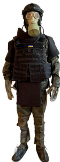
Рис. 1. Варіант 2 захисту саперу, який передбачає використання фільтрувального протигазу