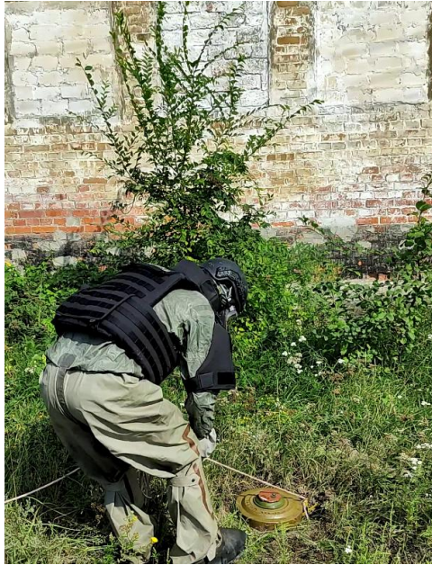
Рис. 3. Зачеплення протитанкової міни

Також треба відмітити, що одягання захисного комплекту піротехнік здійснював за допомогою другої особи, а під час реалізації варіанту 3 апарат на стисненому повітрі одягався після надягання захисних комбінезона та куртки, маски, капюшону, захисних рукавиць та бронежилету, тоді відповідно варіанту 1 фільтруючий респіратор та захисні окуляри або варіанту 2 – фільтруючий протигаз одягався після захисних комбінезонів та куртки. В усіх випадках одягання захисного комплекту закінчувалось одяганням захисної каски з візором.