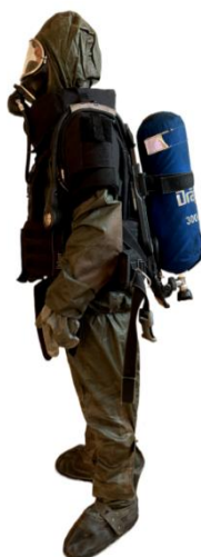
Рис. 2. Варіант 3 захисту саперу, який передбачає використання ізолюючого апарату

У якості контрольної вправи було обрано «зісмикування вибухонебезпечного предмету». Її вибір пояснюється тим, що практика розмінування забрудненої вибухонебезпечними предметами місцевості після її звільнення від російських окупантів показала, що, навіть, на мирних територіях вони використовують підступну практику подвійного мінування, коли основна міна додатково мінується міною-ловушкою [18, 19].