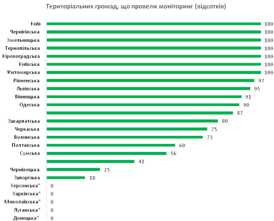
Рис. 1. Кількість обстежених територіальних громадах на предмет безбар'єрності фізичного оточення у 2022 році (у %)

Кіровоградській, Київській та Житомирській областях і в м. Києві. У менших масштабах проходив моніторинг об'єктів фізичного оточення в Чернівецькій і Запорізькій областях, де до його проведення долучилися 25% та 18 % громад відповідно. Найбільша ж кількість об'єктів, серед визначених типів, була обстежена в таких регіонах: 1) Київській області – 1353 об'єкти; 2) Дніпропетровській області – 1077 об'єктів; 3) Хмельницькій області – 1007 об'єктів [6].