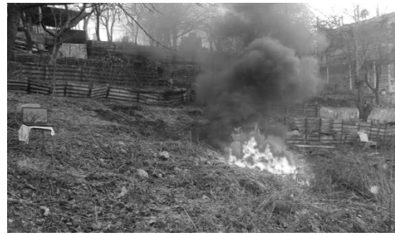
Рис. 3. Проведение эксперимента по измерению ослабления мощности сигнала при воздействии огнем

Интенсивность сигнала измерялась в dBm и отображалась на осциллограмме, которая представляет собой график зависимости мощности приходящего сигнала на приемник от времени его прихода (рис. 4).