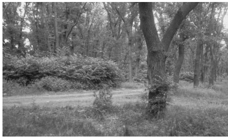
Рис. 2. Проведение эксперимента по замеру ослабления мощности сигнала в лесном массиве

Передача данных проводилась по беспроводному каналу связи Wi-Fi IEEE 802.11 в частотном диапазоне 2,4 ГГц и мощностью сигнала 100 мВт при коэффициенте усиления антенны не более 6 дБ [9]. Измерение мощности сигнала проводился с помощью персонального компьютера, программным обеспечением Hounddale версии 1.40.