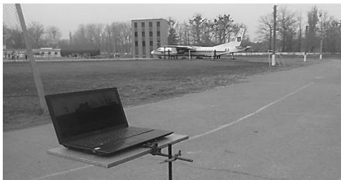
Рис. 1. Проведение эксперимента по замеру ослабления мощности сигнала на открытой местности

В данной части эксперимента моделировался лесной пожар подстилающей поверхности (рис. 3).