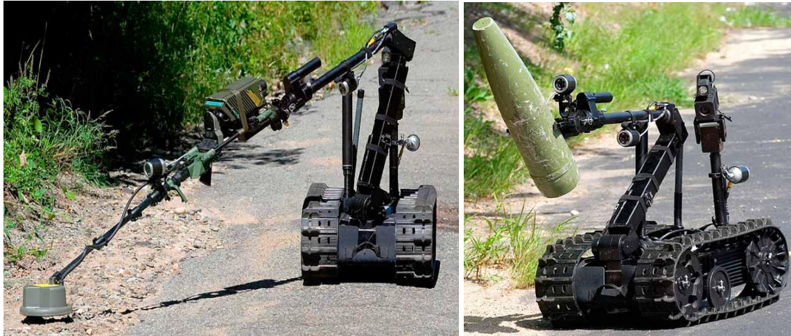
Рис. 1. Американський дистанційно керований робото-технічний комплекс «TALON»

Наймасовішим американським військовим роботом (випущено понад 3 тис. одиниць) є дистанційно-керована машина (ДКМ) «TALON», розроблена компанією Foster-Miller [13, 14] (рис. 1).