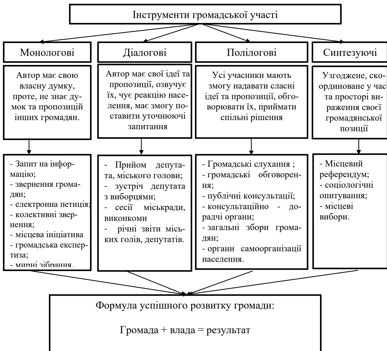
Рис. 2. Інструменти громадської участі Примітка: систематизовано авторами [14, С.5-8].

Окрім запропонованих моделей, для кращого розуміння, варто звернути увагу на систему інструментів громадської участі, які можуть використовуватися всередині громад (рис. 2).