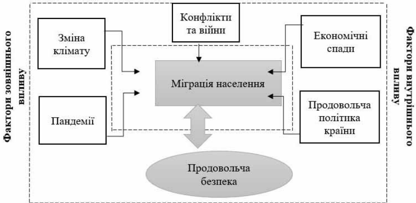
Рис. 1 Фактори впливу на міграцію населення у контексті формування продовольчого потенціалу