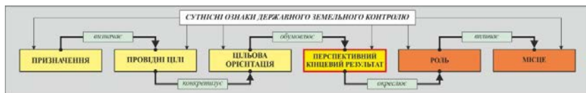
Рис. 1. Ланцюг сутнісних ознак державного земельного контролю

контролю як функції державного управління в області регулювання земельних відносин.