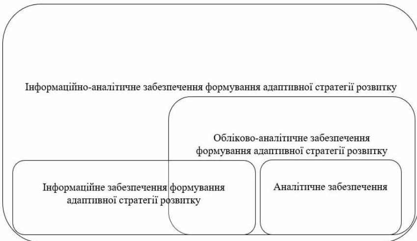
Рис.1. Логічна схема інформаційно-аналітичне забезпечення формування адаптивної стратегії розвитку підприємства

В цілому, інформаційно-аналітичне забезпечення формування адаптивної стратегії розвитку підприємства можна представити у вигляді логічної схеми (рис.1).