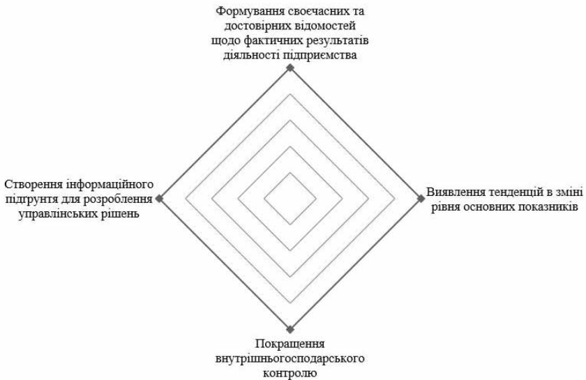
Рис.1. Основні завдання інформаційно-аналітичного забезпечення інвестиційної безпеки підприємства

Можна виділити ключові завдання інформаційно-аналітичного забезпечення інвестиційної безпеки підприємства (рис.1).