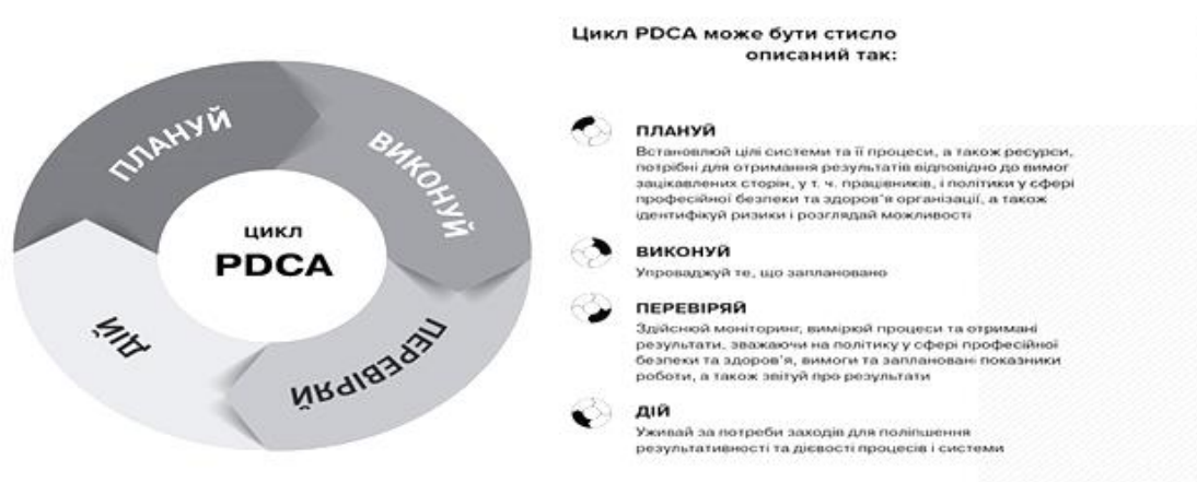
Рис. 2. Цикл Шухарта-Демінга PDCA

У березні 2018 року був опублікований стандарт ISO 45001:2018. Системи управління охороною здоров'я та безпекою праці, який розроблений для заміни стандарту OHSAS 18001:2007. Структура ISO 45001:2018, як і стандарту OHSAS 18001:2007, побудована за циклом Шухарта-Демінга PDCA (рис. 2) [11]. ISO 45001 побудовано за, так званою, високорівневою структурою ISO (HLS — High Level Structure). HLS складається з 10 положень/розділів, згідно з якими структурується зміст усіх стандартів ISO, що стосуються систем менеджменту. Зазначена структура дозволяє вибудовувати в організації інтегровану систему управління, створену на ризик-орієнтованому підході. Тому саме процес управління ризиком стає невід'ємною складовою стратегії всієї організації [13].