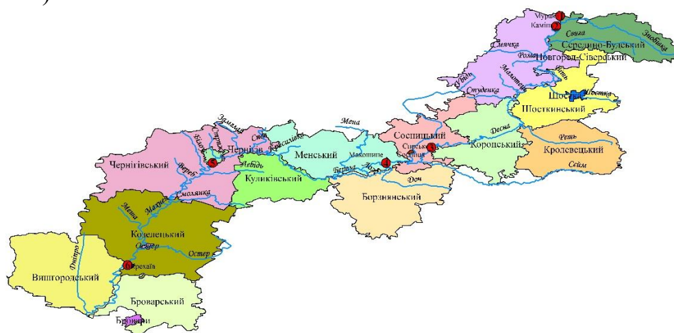
Рис. 1 – Схематичне розміщення 6 постів моніторингу річки Десна, за даними яких проводилось дослідження

На основі даних інтерактивної карти «Моніторинг та екологічна оцінка водних ресурсів України» Державного агентства водних ресурсів України можливо використати вихідні дані для проведення моніторингу поверхневих водних об'єктів за певний проміжок часу за показниками, такими як, нітрати, нітрити, фосфати, іони амонію, сульфати. У дослідженні було проведено аналіз зміни екологічного стану однієї з найбільших приток Дніпра – річки Десна за 2012 – 2020 рік на основі даних з 6 постів спостереження річки Десна (рисунком 1): 1) 573 км, с. Мурав'ї, Новгород-Сіверського р-ну; 2) 569 км, с. Камінь, Новгород-Сіверського р-ну; 3) 390 км, с. Спаське, Сосницького р-ну нижче Смоленської АЕС; 4) 350 км, смт. Макошино, Менського р-ну; 5) 200 км, м. Чернігів; 6) 55 км, с. Крехаїв, Козелецького р-ну (кордон Чернігівської і Київської обл.).