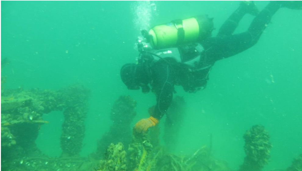
Рис. 2. Пошук вибухонебезпечних предметів під водою

Для вирішення поставленого завдання спочатку були проведені експериментальні дослідження, в яких брали участь випробовувані з числа особового складу відділення підводного розмінування групи піротехнічних робіт та спеціальних водолазних робіт аварійно-рятувального загону спеціального призначення Головного управління ДСНС України у Херсонській області. Вони на протязі весни-літа 2020 року виконували реальні операції пошуку (рис. 2) на глибині 4 м, 6 м та 7 м та підйому (рис. 3) з глибини 6 м, у тому випадку, коли була відсутня можливість знищення на місці, вибухонебезпечних предметів в акваторії Чорного моря, яка вимагає свого розмінування.