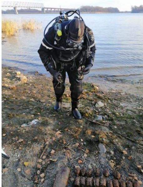
Рис. 1. Боєприпаси, вилучені з-під води в Херсонській області протягом одного дня

Тому проблема підвищення ефективності попередження надзвичайних ситуацій, пов'язаних з підводним розташуванням вибухонебезпечних предметів, є актуальною.