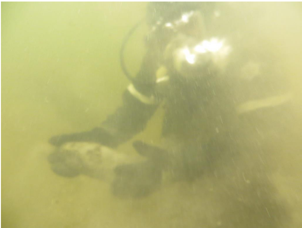
Рис. 3. Підйом вибухонебезпечних предметів з-під води