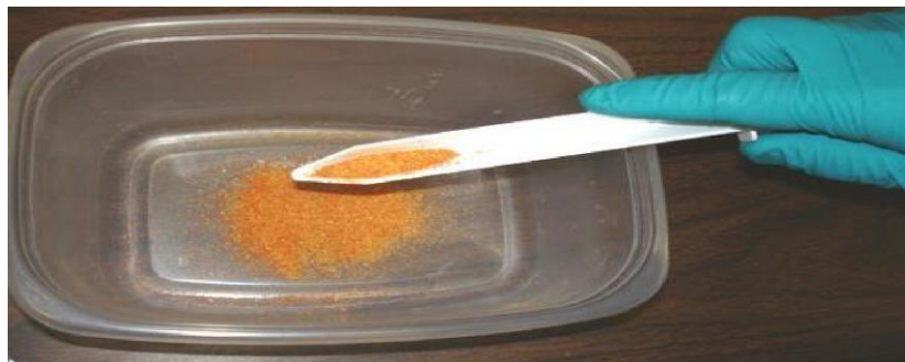
Fig. 4. Sterile spoon for granular solids substances and powders

Also, powdery samples can be taken with a spatula, spoon or spatula.