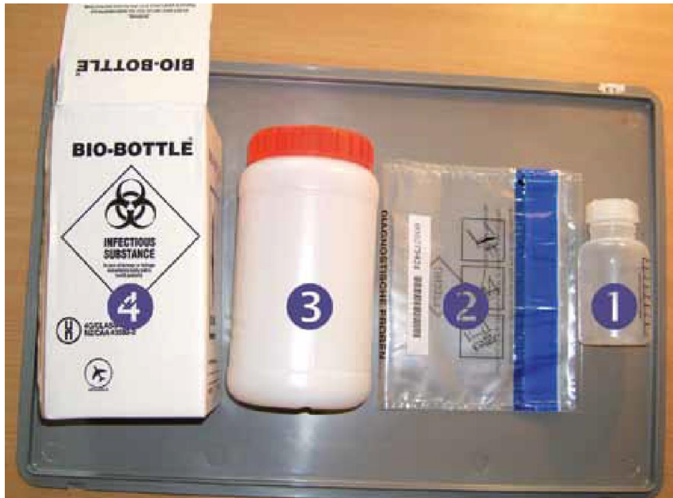
Fig. 1. Sample packaging container

The following sampling tools are available (Fig. 2).