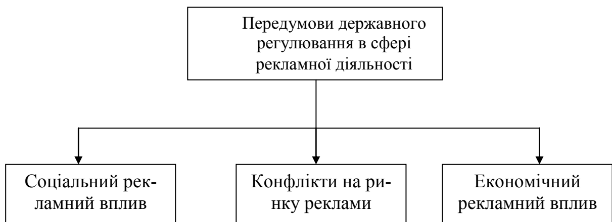
Рис. 1. Передумови державного регулювання в сфері рекламної діяльності

Деякі дефініції механізму державного регулювання в сфері рекламної діяльності зустрічаються фрагментарно, стосовно його визначених різновидів. Зокрема, А. І. Швець присвячує свої дослідження організаційно-економічному механізму регулювання рекламної діяльності в Україні та ви-