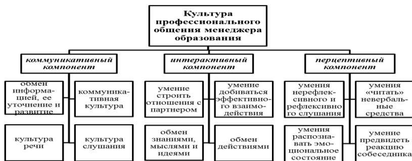
Рис. 1. Культура профессионального общения менеджера образования

В соответствии с этим структура культуры профессионального общения менеджера образования может быть схематично изображена следующим образом (рис. 1).