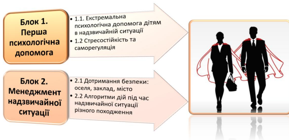
Рис. 2. Схема блоків тренінгу “Перші кроки до безпеки”

На сьогодні необхідно приділити більшу увагу моніторингу проведення атестації робочих місць за умовами праці (осіб, які працюють зі шкідливими, небезпечними, важкими умовами праці) на підприємствах, в організаціях та установах районів міста. Здійснювати моніторинг проведення навчання з охорони праці посадових осіб, працівників, зайнятих на роботах підвищеної небезпеки, на підприємствах, організаціях та установах районів міста. Здійснювати моніторинг дотримання чинних колективних договорів, які мають розділи «Охорона праці» та «Комплексні заходи щодо досягнення встановлених нормативів безпеки, гігієни праці та виробничого середовища, підвищення існуючого рівня охорони праці, запобігання випадкам виробничого травматизму, професійного захворювання, аваріям і пожежам», на підприємствах, в організаціях та установах районів міста.